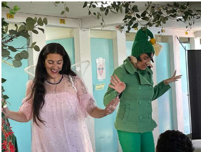
La Fée et Lutine lors du Festival "Viva La Vulva", Juin 2022

La Fée / Parle du plaisir et de l'intimité, et fait des bulles